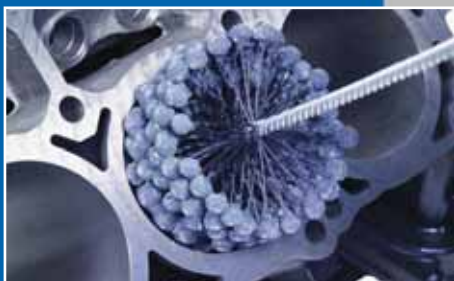
Surface finish of a cylinder bore...